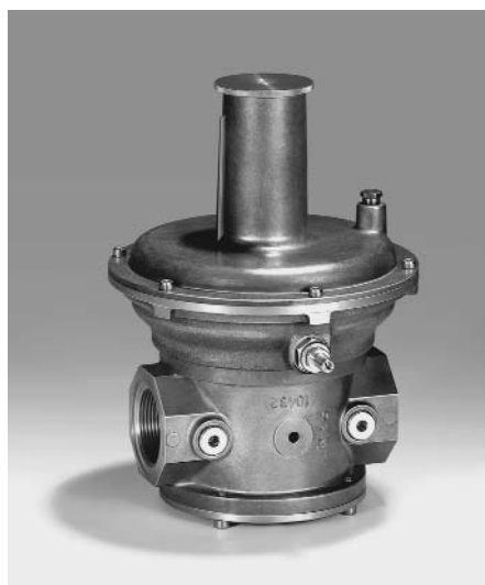
Bild 3: Umlaufregler Typ: KROMSCHRÖDER VAR Fig. 3: VAR speed governor (KROMSCHRÖDER)