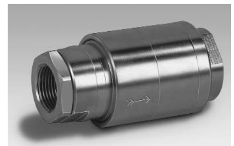
Bild 4: Gasrücktrittssicherung Typ: KROMSCHRÖDER GRS Fig. 4: Type GRS gas non-return valve (KROMSCHRÖDER)