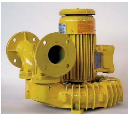
Bild 6: Seitenkanalverdichter Typ MAPRO CL Fig. 6: Type MAPRO CL side-channel compressor

Grundsätzlich ist zu beachten, dass der Gasdruck im Ausgang der GDEE und somit auch im nachfolgenden Leitungsnetz über dem Eingangsdruck liegt. Beim Abschalten der Anlage muss verhindert werden, dass