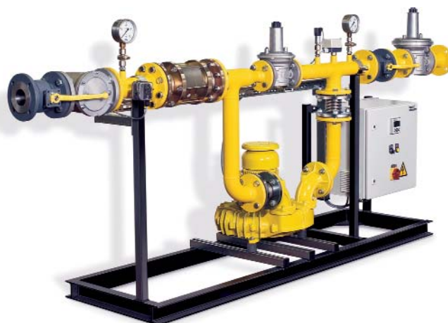
Fig. 1: Type GDEE compact design gas-pressure booster, supplied ready-for-connection

der Gasversorgung führen) auftreten können.